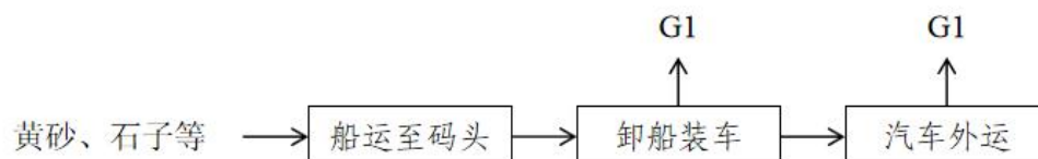
图 4-2 出口货物装卸流程图