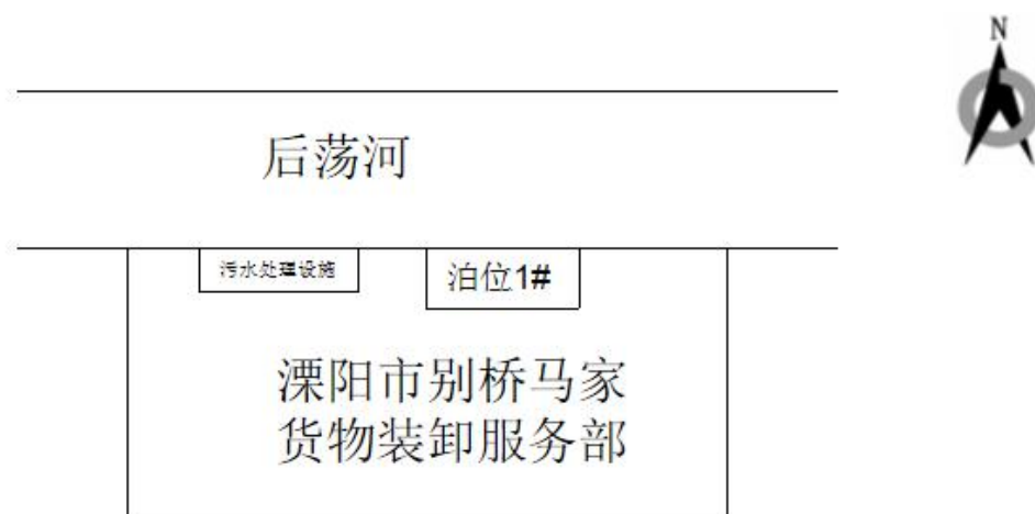
图4-3 厂区平面布置图