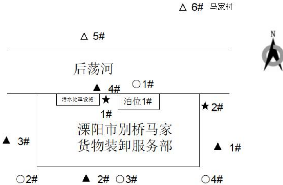
图 8-1 验收监测布点图示